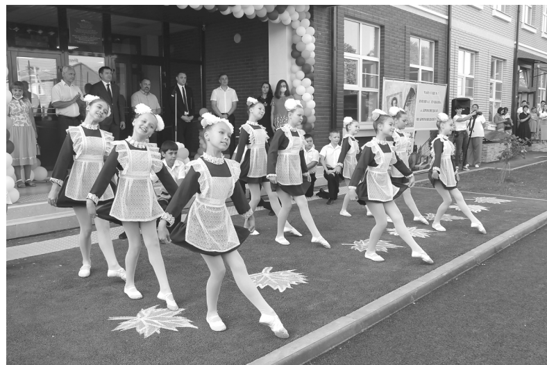
Торжественная линейка в новой школе