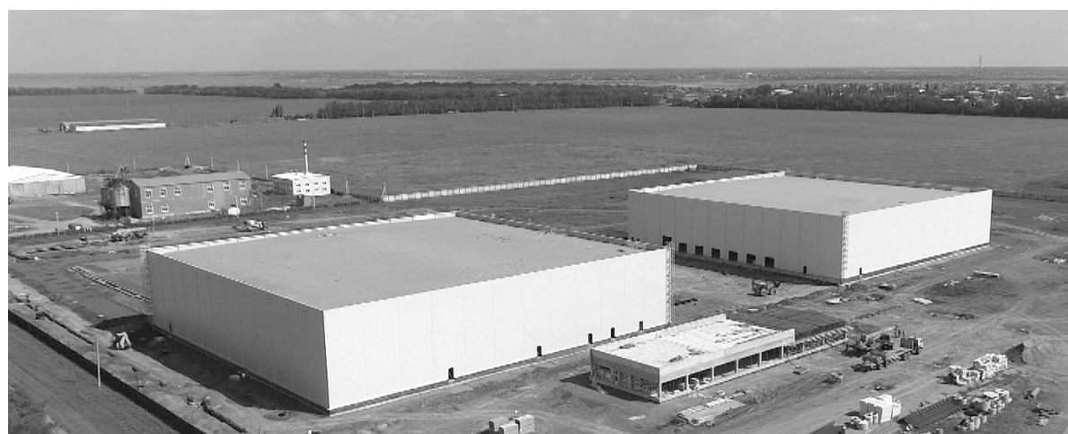
Строительство логистического центра «Ренус Фрейт Логистик»

— продолжение работы по привлечению инвесторов на незадействованные имущественные комплексы;