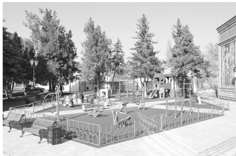
Территория, прилегающая к ДК имени И. И. Буренкова

Задачи на 2022 год: — завершить работу по внесению изменений в генеральные пла-