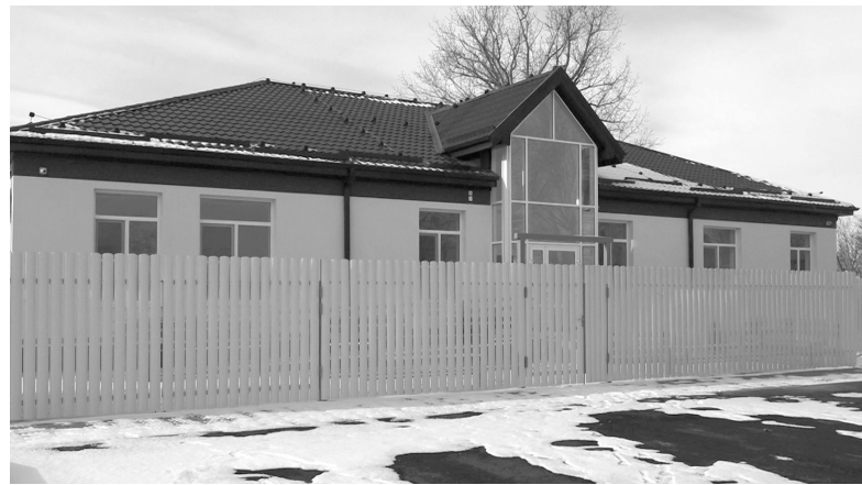
Офис врача общей практики в селе Большой Бейсуг

культурного наследия согласовало первоочередные мероприятия (сметы) по его сохранению. Эти документы открывают дорогу для начала ремонтных работ по приведению исторического здания в надлежащий вид.