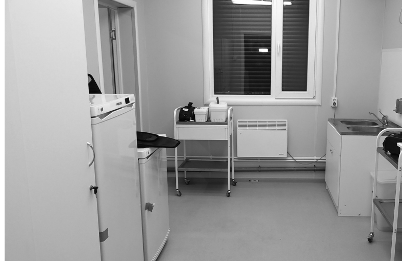
Фельдшерско-акушерский пункт в хуторе Кубань

В районе работает одно учреждение дополнительного образования детей (ДЮСШ) и два учреж-