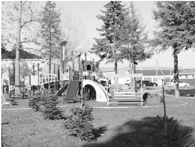
Детская площадка в парке станции Новоджерелиевской

ЖКХ — тема всегда актуальная. Если смотреть социологию, то оно