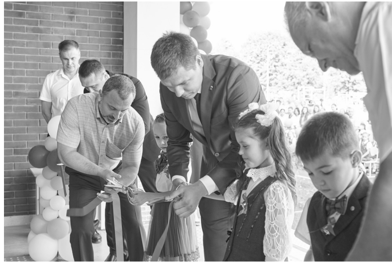
Открытие корпуса начальной школы СОШ №3

Одно из значимых направлений — гражданское и патриотическое воспитание молодежи.