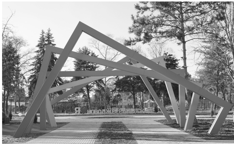
Парк «Центральный» в станице Новоджерелиевской

В детских садах Брюховецкого района мы запустили пилотный проект по организации раздельного сбора мусора — пробуем с ранних лет воспитывать у подрастающего поколения привычку сортировать мусор. Закупили пластиковые контейнеры, нанесли на них схематичные маркировки, обозначающие вид собираемого мусора: «пластик», «стекло», «бумага». Отходы после проведения занятий (обрезки бумаги, пластик) ребята складывают в соответствующие разноцветные боксы. Таким образом при поддержке семей воспитанников педагоги вносят вклад в воспитание у наших детей бережного отношения к природе.