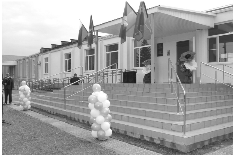
Дом культуры в хуторе Гарбузовая Балка

В учреждениях отрасли работают 290 человек, из них заслужен-