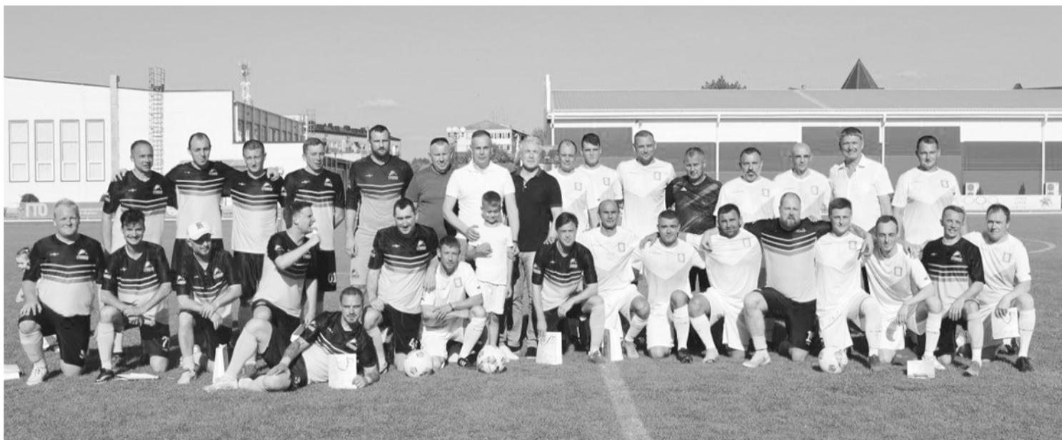
Команды — участники акции «Игра добра»

— Итоги 23-й смены. Ребят много. Но мы очень стараемся помочь каждому. Помогли медикаментами, вещами, колясками и прочими позициями. Отвезли подушки, одеяла, маски и медкостюмы на склад, с которого скоро всё отвезут в госпитали. Весь день встречали и отправляли ребят. Находили общий язык с теми, кто по-русски совсем ноль. Проводили ребят в Североморск, раздали все наши шатки. Послушали истории наших героев, кого, как и чем накрыло. Говорят они только о войне... Честно, нам тяжело и физически, и морально. Каждый вторник мы выдаем из мирной и семейной жизни на сутки. И мы будем продолжать дежурить столько, сколько потребуется нашим ребятам. Они заслужили наше внимание, заботу и поддержку. На фото наша вчерашняя волонтерская семья, только без водителей: они у нас всегда в разъездах, выполняют очень важные миссии.